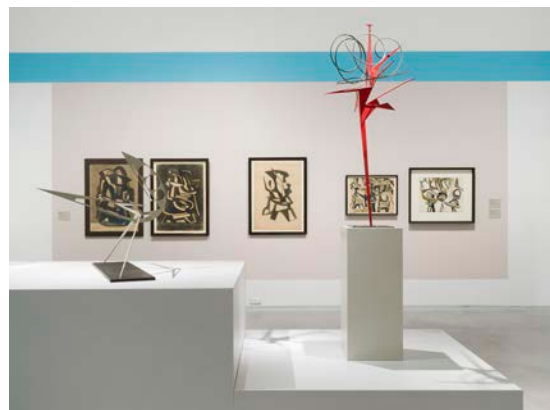
Ausstellungsansicht „Hans Uhlmann. Experimentelles Formen“, Berlinische Galerie