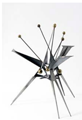
Hans Uhlmann, Endgültiger Entwurf zur Skulptur auf dem Hansaplatz, Berlin, 1958 © VG Bild-Kunst, Bonn 2024