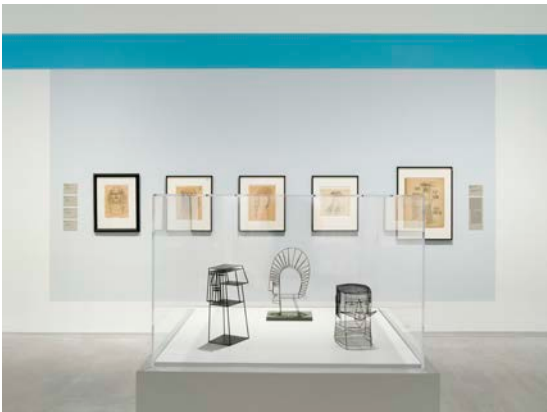
Ausstellungsansicht „Hans Uhlmann. Experimentelles Formen“, Berlinische Galerie