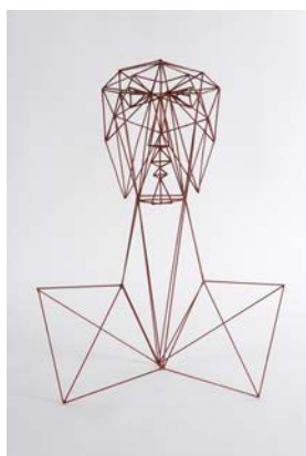
Hans Uhlmann, Weiblicher Kopf, 1938 © VG Bild-Kunst, Bonn 2024