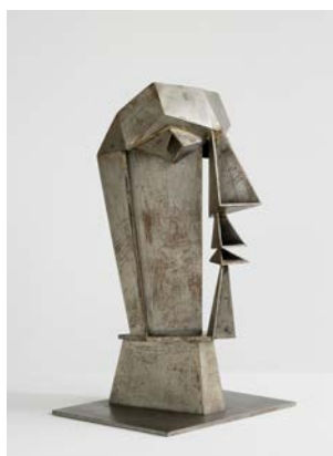
Hans Uhlmann, Männlicher Kopf, 1942 © VG Bild-Kunst, Bonn 2024, Foto: Lehbruck Museum, Duisburg / Jürgen Diemer