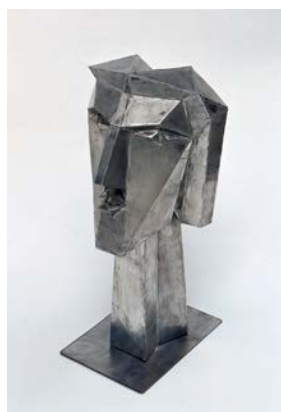
Hans Uhlmann, Weiblicher Kopf, 1940 © VG Bild-Kunst, Bonn 2024