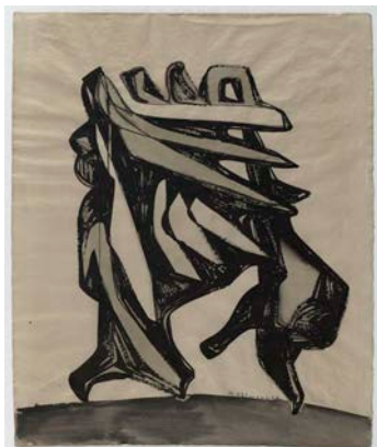
Hans Uhlmann, Ohne Titel, 1947 © VG Bild-Kunst, Bonn 2024, Foto: Anja Elisabeth Witte