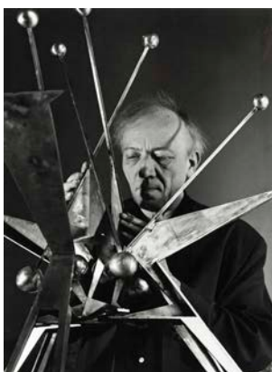
Hans Uhlmann am Modell zur Plastik im Hansaviertel in Berlin, ohne Datierung, Foto: Ewald Gnilka © Rechtsnachfolger*innen Ewald Gnilka; für das Werk von Hans Uhlmann: © VG Bild-Kunst, Bonn 2024