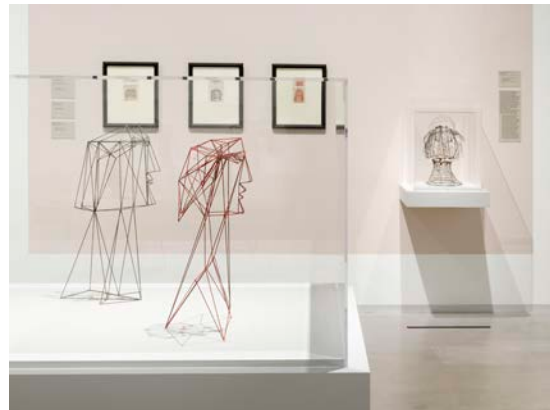
Ausstellungsansicht „Hans Uhlmann. Experimentelles Formen“, Berlinische Galerie