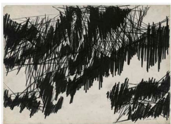
Hans Uhlmann, Ohne Titel, 1963 © VG Bild-Kunst, Bonn 2024, Foto: Anja Elisabeth Witte