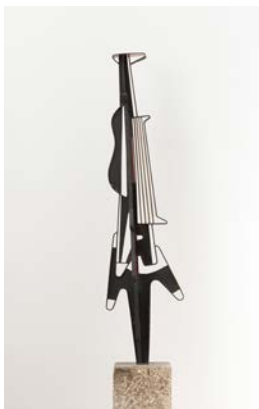
Hans Uhlmann, Stahlskulptur, 1951