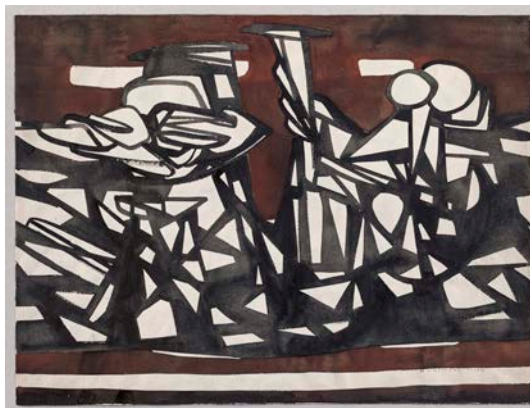
Hans Uhlmann, Gruppe, 1951 © VG Bild-Kunst, Bonn 2024