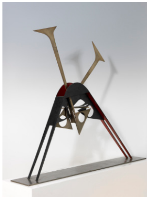
Hans Uhlmann, Stahlplastik (Bogen), 1954 © Galerie Michael Haas, Berlin / VG Bild-Kunst, Bonn 2024, Foto: Lea Gryze