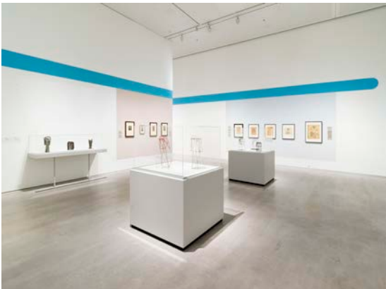
Ausstellungsansicht „Hans Uhlmann. Experimentelles Formen“, Berlinische Galerie