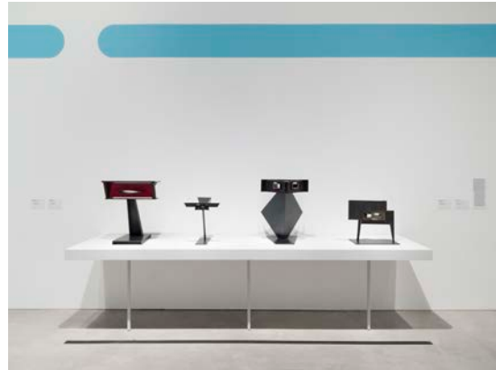
Ausstellungsansicht „Hans Uhlmann. Experimentelles Formen“, Berlinische Galerie