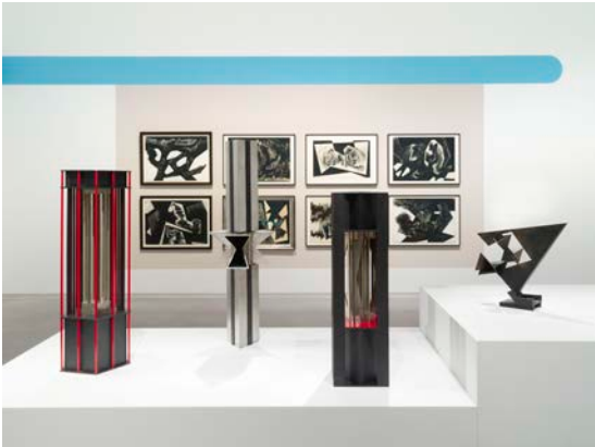
Ausstellungsansicht „Hans Uhlmann. Experimentelles Formen“, Berlinische Galerie