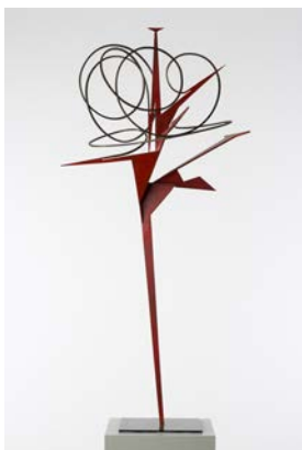
Hans Uhlmann, Ohne Titel, 1956 © VG Bild-Kunst, Bonn 2024, Foto: bpk / Sprengel Museum Hannover, Kunstbesitz der Landeshauptstadt Hannover / Aline Gwose, Benedikt Werner