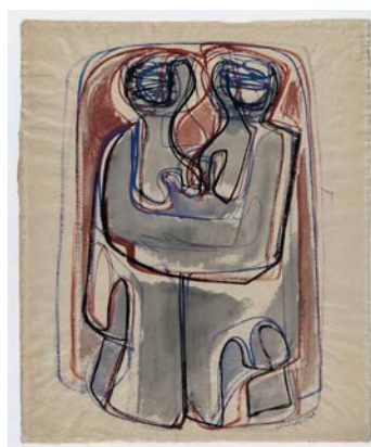
Hans Uhlmann, Ohne Titel, 1947 © VG Bild-Kunst, Bonn 2024, Foto: Anja Elisabeth Witte