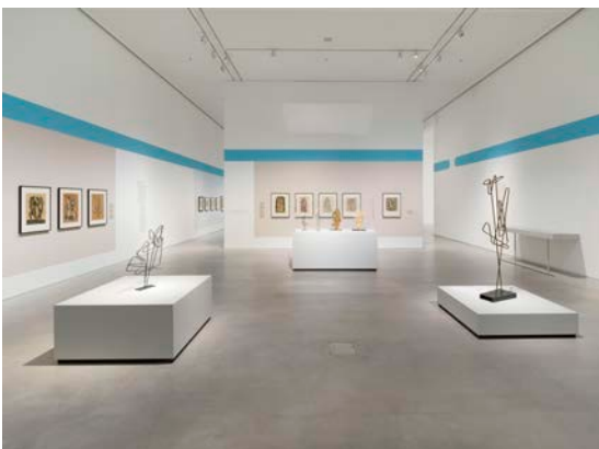
Ausstellungsansicht „Hans Uhlmann. Experimentelles Formen“, Berlinische Galerie