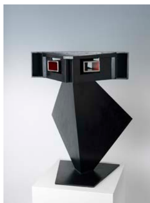
Hans Uhlmann, Kopf-Fetisch II, 1967 © Galerie Michael Haas, Berlin / VG Bild-Kunst, Bonn 2024, Foto: Lea Gryze