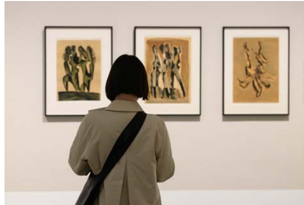
Ausstellungsansicht „Hans Uhlmann. Experimentelles Formen“, Berlinische Galerie