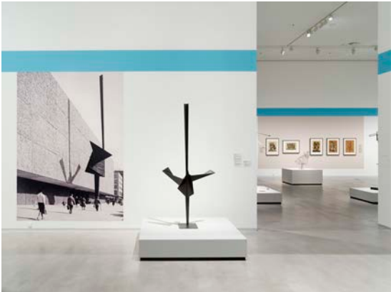
Ausstellungsansicht „Hans Uhlmann. Experimentelles Formen“, Berlinische Galerie